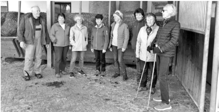
Auch unsere kleine Gruppe war sehr angetan und dankbar für diese Hofbesichtigung mit kompetenten Informationen aus erster Hand.