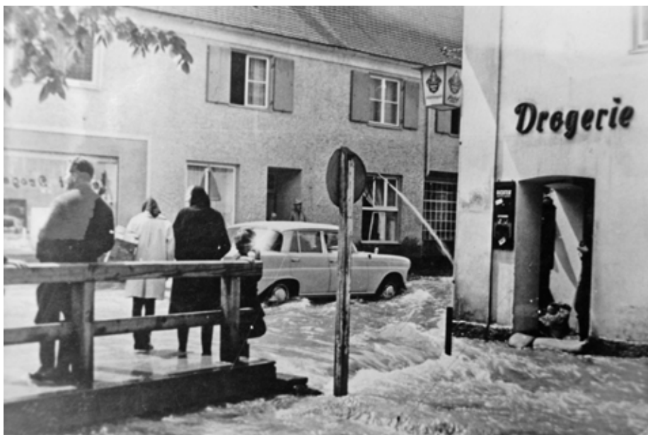
Das Günz-Hochwasser machte über viele Jahre den Geschäftsinhabern zu schaffen.

Das gemächlich fließende Günzwasser kann sich aber auch mächtig aufbäumen. Wie so oft, haben vor allem die Gewitter mit Wolkenbruch ähnlichen Niederschlägen in den Monaten Juni und Juli schon verheerende Hochwasser-Schäden an Gebäuden und Fluren verursacht. Im Obergünzburger Tagblatt vom 3. Juli 1953 wird von einem schweren Unwetter über dem Günztal berichtet. Innerhalb von wenigen Minuten, so erzählten seinerzeit die vom Unwetter Betroffenen, stürzten solche Wassermassen vom Himmel, dass sich in kürzester Zeit die Verbindungsstraßen von den Höhen in die Orte zu reißenden Flüssen verwandelten. Das Wasser stand bis zu einem Meter hoch in den Straßen und schwemmte Holz, Schlamm und Schotter mit sich.