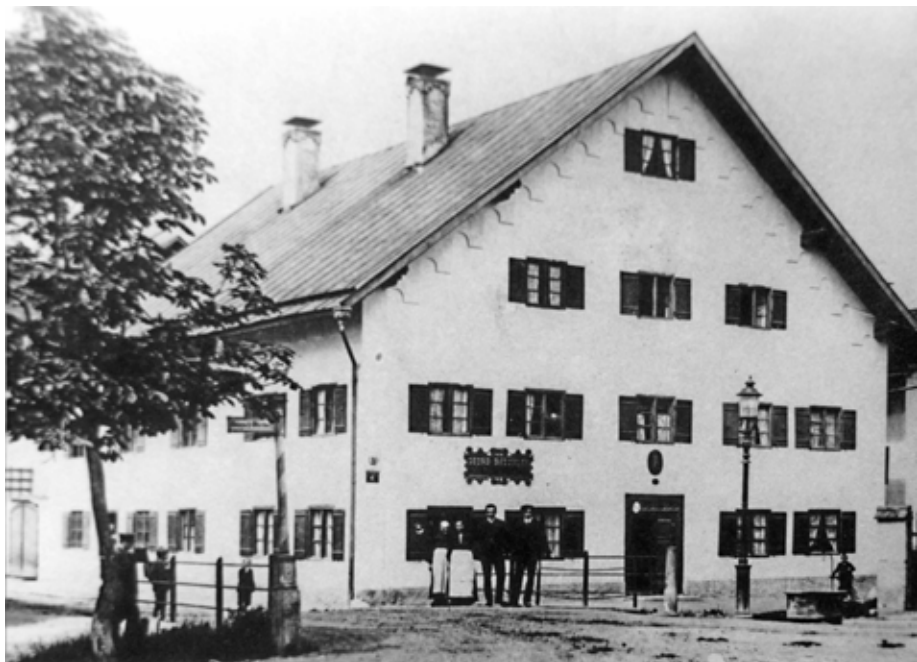
Im ersten Stock des Gebäudes an der Günz, Kemptener Straße 2 sind seit über 130 Jahren die Praxisräume für die Zahnheilkunde untergebracht. Im Erdgeschoß betrieb über fünfzig Jahre von 1948 bis 2004 die Familie Weinert die Hubertus-Drogerie.