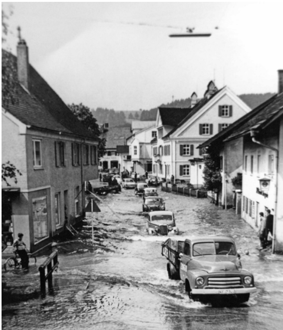
Wie so oft im vergangenen 20. Jahrhundert, wurde der Marktflcken vom Hochwasser heimgesucht. Auch in der Kemptener Straße in Obergünzburg waren Autos nur noch im Schritttempo unterwegs.