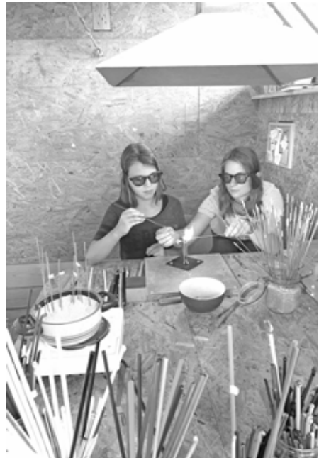
Glasperlen-Aktion 2019

Michaela Wöflle Team Günztaler Ferienfreizeit