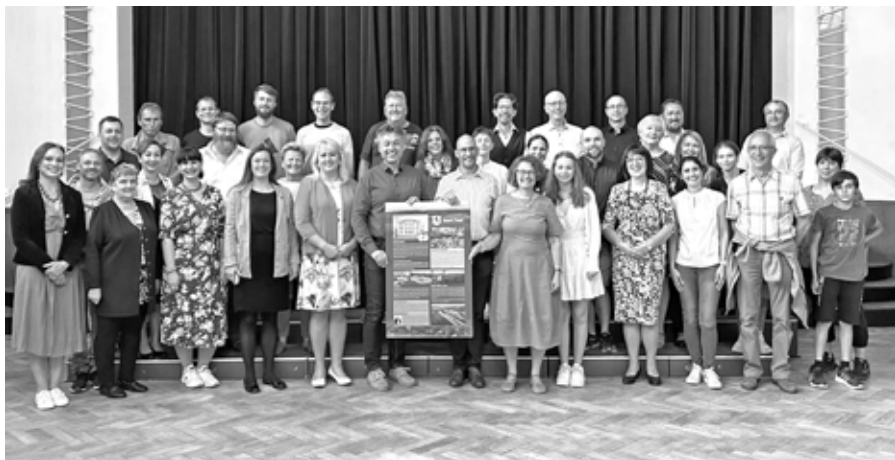
Übergabe der Freundschaftstafel im Kulturhaus

Informieren Sie sich gerne über die Details ab Seite 8.