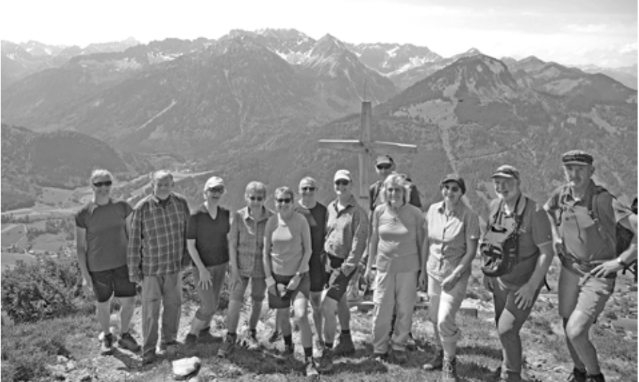
Gipfel vom Hirschberg.