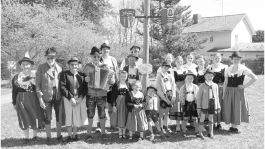
„Maibaumaufstellen“ – eingebettet in ein Fest, das Tradition und Gemeinschaft eindrucksvoll verbindet. Ein großer Dank geht an die Trachtengruppe D'Günztaler.