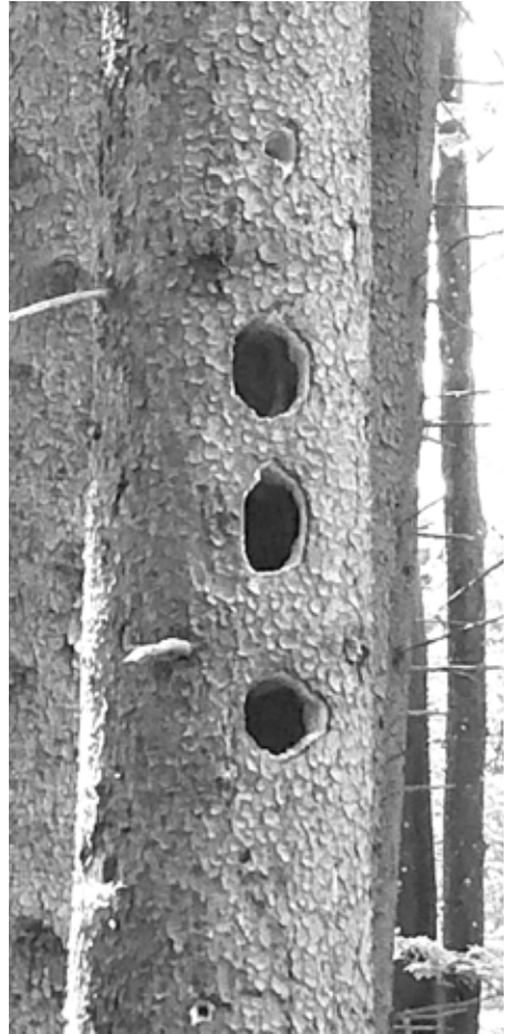
Spechtflöte, angelegt durch Schwarzspecht

Dass die Rohrhalde ein artenreicher Lebensraum ist, davon konnten sich die interessierten Exkursionsteilnehmer selbst