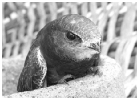
Mauersegler – Apus apus juv. kurz vor Auswilderung.

Aus einer Erfolgsquote von 75–80 % Individuen, die ausgewildert werden können, spricht die langjährige Pflegeerfahrung von Annette Schneider. Verletzungen oder auch Krankheiten können oft mit Hilfe von heimischen Tierärzten geheilt werden. Und manche Vogelliebhaber, die selbst einen gestrandeten Vogel bis zur Auswilderung betreuen wollen, finden bei Annette Rat