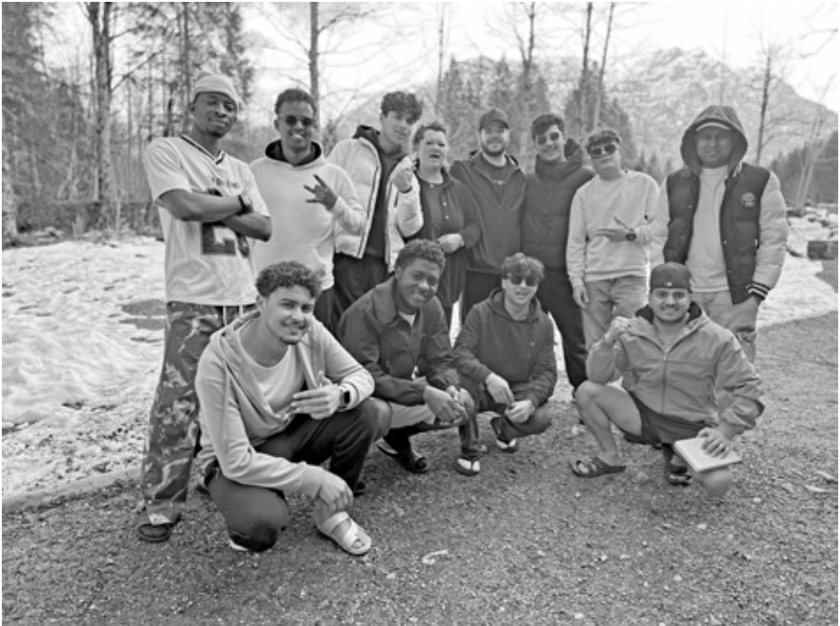
Zehn Jugendliche der BRK-Wohngruppe in Obergünzburg und ihre Betreuer verbrachten über Ostern ein erlebnisreiches Hüttenwochenende inmitten der Oberammergauer Berge.

Die Gruppe erlebte abwechslungsreiche Tage in winterlicher Umgebung. Während im Tal bereits der Frühling Einzug hielt, lag in den Bergen noch rund ein halber Meter Schnee. Auf dem Programm standen deshalb eine Rodeltour sowie eine ausgedehnte Schneewanderung. Daneben blieb viel Zeit für gemeinsames Kochen, Gesellschaftsspiele, Grillen und Lagerfeuer. Auch