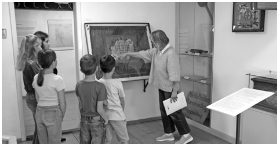
Der Blick in die Zunft-Stube im Heimatmuseum zeigt über dreißig Handwerksberufe früherer Zeit.