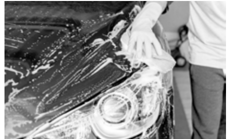
Wer auf Nummer sichergehen will, erledigt die Autowäsche auf einem dafür vorgesehenen Waschplatz. Dort ist das Autowaschen erlaubt und man kann trotzdem von den Vorteilen der händischen Autowäsche profitieren.

Die Probleme bei der Autowäsche stellen zum einen die oftmals aggressiven Reiniger dar, zum anderen lösen sich bei der Autowäsche aber auch Ölrückstände und Verschmutzungen, wie Teer, die allesamt ins Grundwasser sickern können und damit die Umwelt belasten. Das Wasserhaushaltsgesetz (WHG) ist die einzige bundeseinheitliche Regelung zu diesem Thema, die in Paragraph 48 (siehe Infokasten) vorgibt, dass das Grundwasser vor diesen schädlichen Einflüssen zu schützen ist.