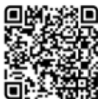
Die Südsee-Sammlung auf bavarikon

In Ergänzung zum Obergünzburger Museum lässt sich der gesamte Sammlungsbestand nun auf bavarikon online erkunden. Zur virtuellen Ausstellung: