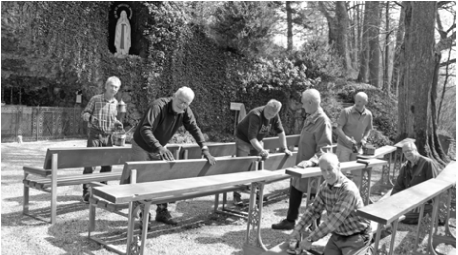
Während die im Pfarrstadel eingewinterten 85 Ruhebänke repariert und teilweise neu gestrichenen, zwischenzeitlich im Ort und im Günztal verteilt und aufgestellt sind, kümmern sich die Aktiven Senioren jetzt um die historischen Bänke in der Lourdesgrotte.

Spenden-Mitwirkung vieler der damaligen Marienverehrer, auch sieben Kniebänke und sieben Sitzbänke für die Grotte. Ob seinerzeit die Zahl Sieben zusammenfassend als die „Heilige Zahl“ schlechthin, für die göttliche Vollendung zum Ausdruck gebracht werden sollte, kann heute jedoch nicht mehr sicher belegt werden. Auf jeden Fall sind die über 130 Jahre alten und historischen Knie- und Sitzbänke mit dekorativen, gusseisernen wunderschönen Seitenwangen und kunstvollen Rückenlehnen aus der Jugendstilzeit um die Wende vom 19. ins 20. Jahrhundert enorm schwer und unverwüstlich. Lediglich die Holzteile der Knie-Sitzflächen und Rückenlehnen mussten im Laufe der Verwitterungsjahre erneuert werden.