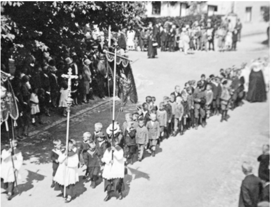
Fronleichnamsprozession 1954.

An vier, mit wunderbaren Blumentepichen geschmückten Altären, wird entsprechend