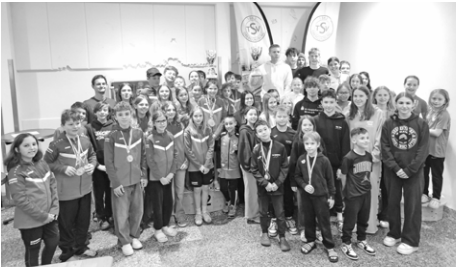
Die Freude über die großen Mannschaftspokale war riesig: Links der veranstaltende TSV Obergünzburg auf Platz zwei, in der Mitte die Sieger der TG Biberach und rechts die drittplatzierten Aktiven des Schwimmteams Neusäß.