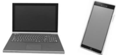
Abbildungen: Microsoft Word

Bringen Sie einfach Ihr Smartphone oder Ihren Laptop mit. Herr Pöppel von der IT-Abteilung des Rathauses nimmt sich Zeit