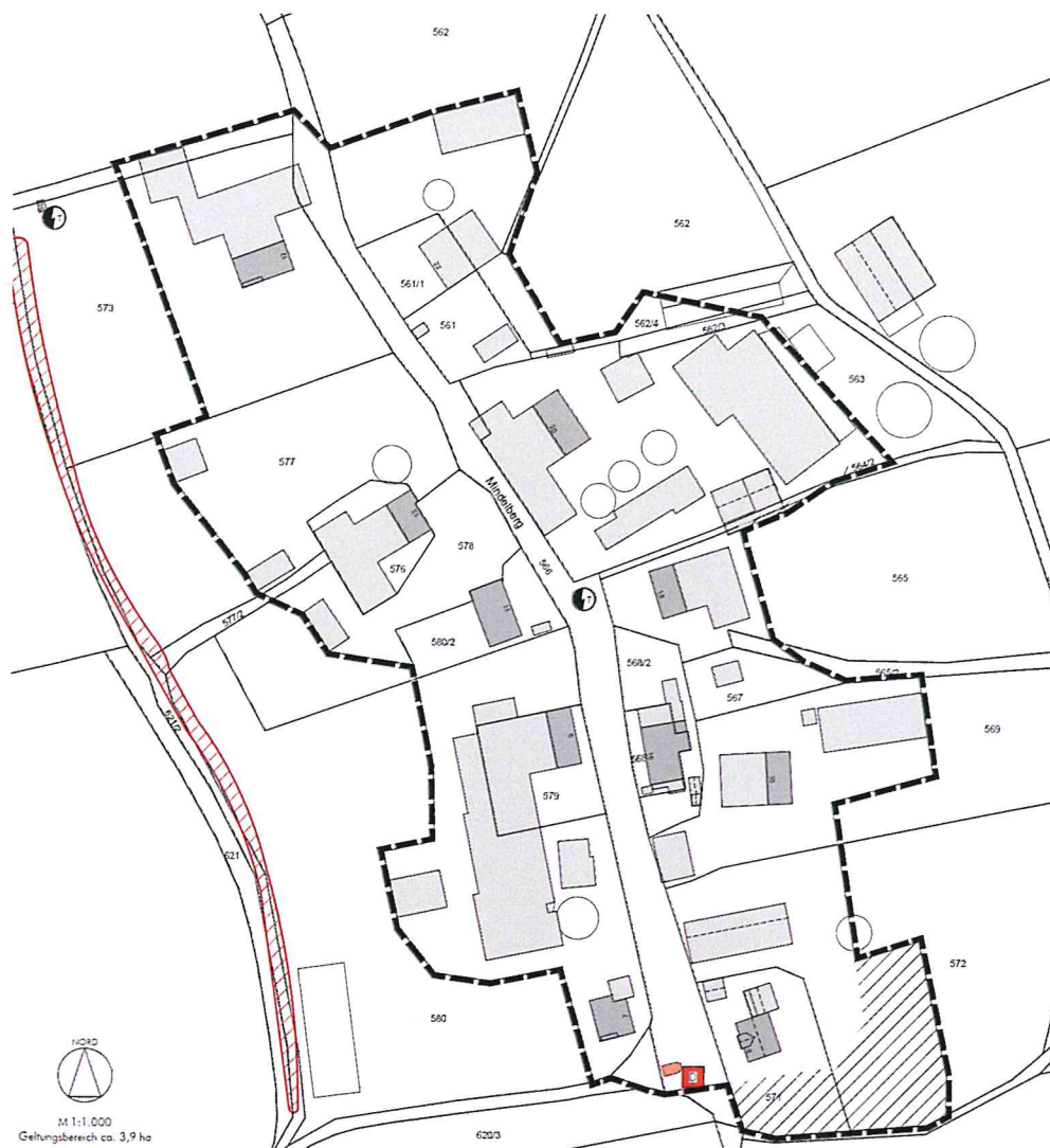
Abbildung 1: Ausschnitt der Planzeichnung der 1. Änderung bei Mindelberg, unmaßstäblich

Im Einzelnen gilt der Lageplan vom 14.04.2026. Der Lageplan ist im folgenden Kartenausschnitt dargestellt: